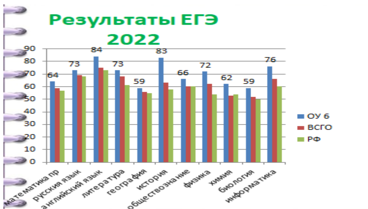
Диаграмма результатов ЕГЭ ОУ 6 в сравнении с городом, областью и Россией

Из диаграммы видно, что в МБОУ СОШ № 6 результаты по ЕГЭ выше по всем предметам по сравнению с городскими, областными и российскими показателями.